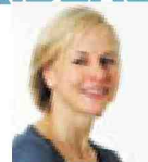
PAR NATHALIE SIMON NSIMON @LEFIGARO.FR

REPRISE DES HOSTILITÉS Théâtre du Petit Saint-Martin , tél. : 01 42 08 00 32.